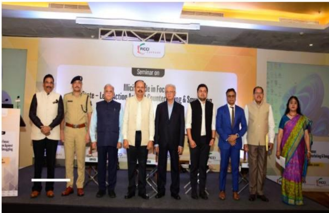
FICCI CASCADE's seminar in Ahmedabad highlights the alarming rise in smuggling and counterfeiting